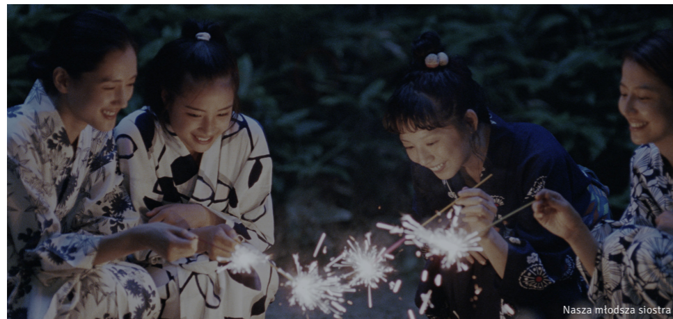
Nasza młodsza siostra

Po nagrodzonym przez jury festiwalu w Cannes filmie „Jak ojciec i syn” Hirokazu Kore-eda powraca z – inspirowaną kinem Ozu – subtelną opowieścią o miłości i bliskości. Trzy siostry mieszkają w wielkim, starym domu w Kamakurze pod Tokio. Kiedy dowiadują się o śmierci ojca, którego nie widziały od 15 lat, jadą na daleką prowincję, aby wziąć udział w pogrzebie. Tam poznają swoją nastoletnią przyrodną siostrę, o której istnieniu nie wiedziały. Zapraszają ją, by zamieszkała razem z nimi i postanawiają zrobić wszystko, by młoda dziewczyna poczuła się częścią rodziny. Film Hirokazu Kore-edu, jednego z najbardziej uznanych współczesnych reżyserów, to realistyczny i pełen niuansów portret relacji między czterema siostrami, a także słodko-gorzka opowieść o ludziach żyjących w nadmorskim mieście. Na tle niezwyklej przyrody opowiada poruszającą historię o skomplikowanych emocjach, poszukiwaniu siebie i powstawaniu prawdziwej rodziny.